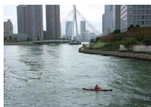
隅田川・越中島公園より（江東、中央区の境界）