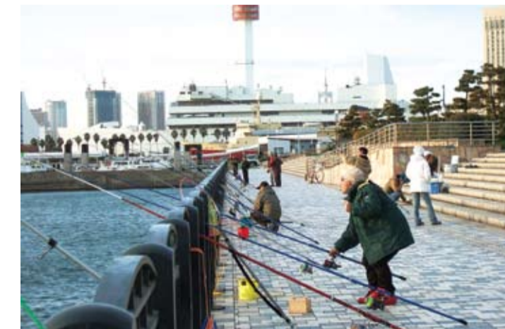
青海南ふ頭公園・ハゼ釣りの休日