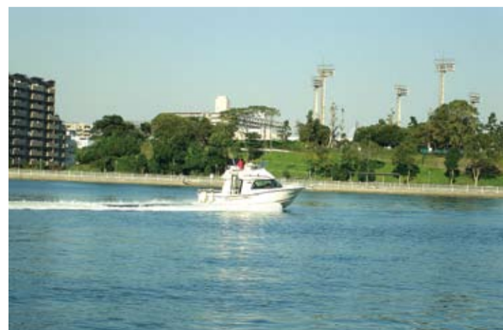
東雲運河の船上から湖見の運動公園の森を見る