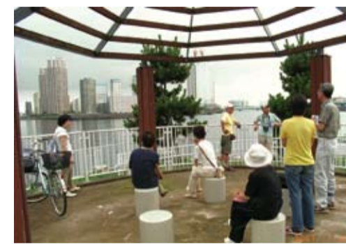
隅田川、再開発の進む豊洲を望みほっと一息・中の島公園展望スペース