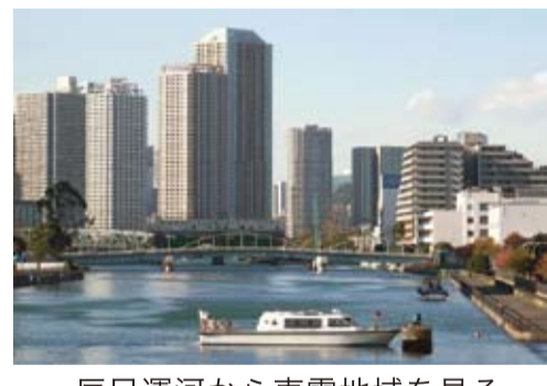
辰巳運河から東雲地域を見る