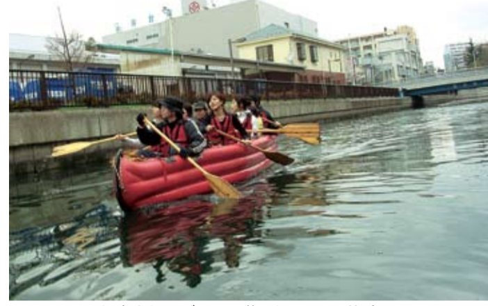
大島川でボート遊びをする若者たち