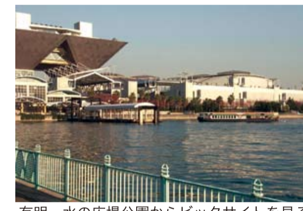
有明・水の広場公園からビックサイトを見る