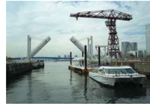
豊洲らばーと内の豊洲乗船場