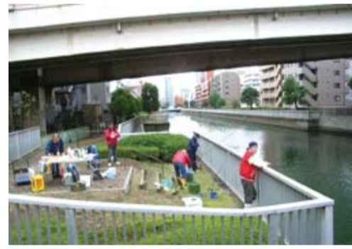
平久川で釣りを楽しむ上は高進入口