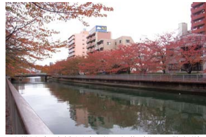
大横川（石島橋より）・桜の紅葉（北辺の散歩道）