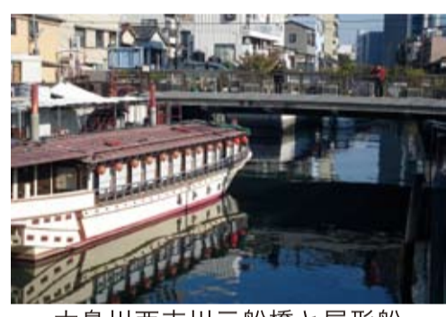
大島川西支川三船橋と屋形船