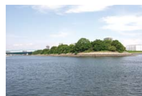
昔の防波堤・東雲運河