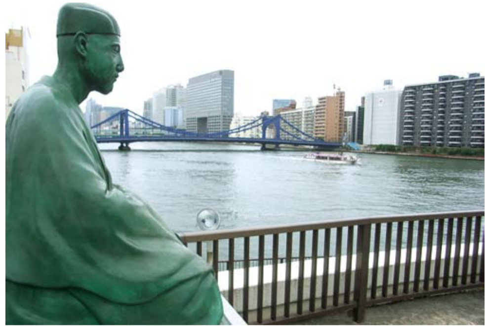
芭蕉像より清洲橋を望む