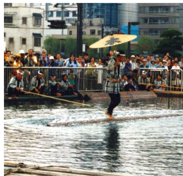
深川木場の角乗り