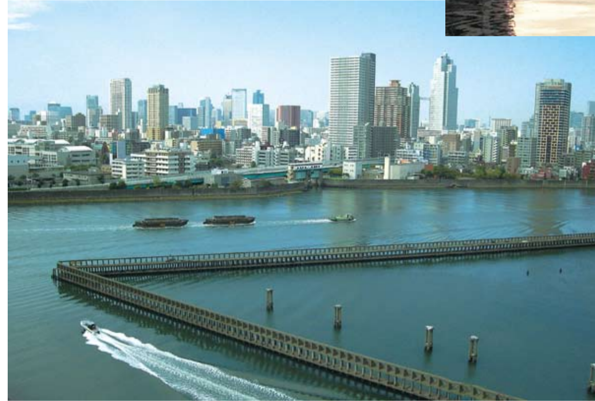
隅田川と豊洲運河の分流点の旧材木置場・隅田川方面を見る