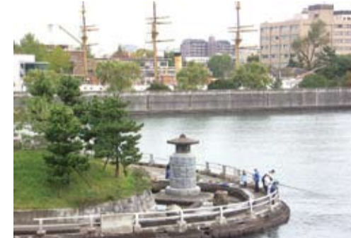
隅田川に分け入った公園・中の島公園向こう側に明治丸が見える