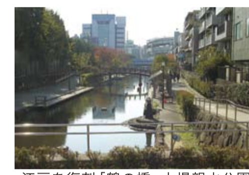
江戸を復刻「鶴の橋」木場親水公園