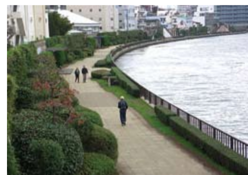
隅田川テラス・新大橋下流