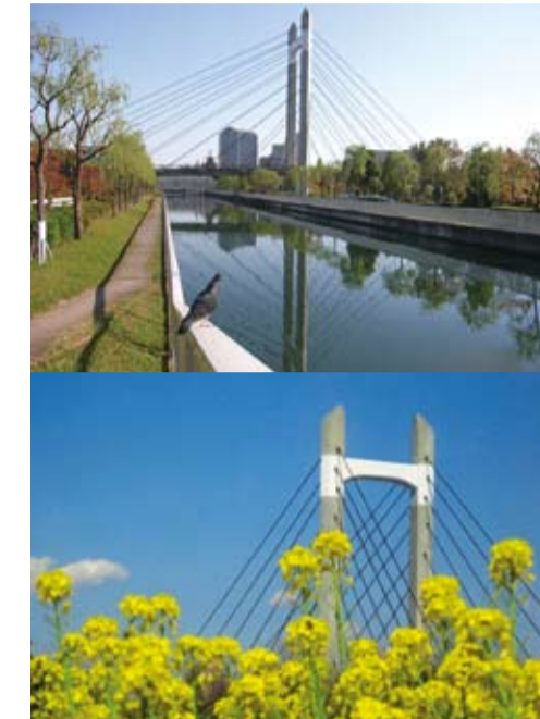
仙台堀川の本場公園大橋