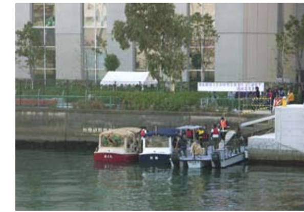
豊洲の芝浦工大で電気ボート体験