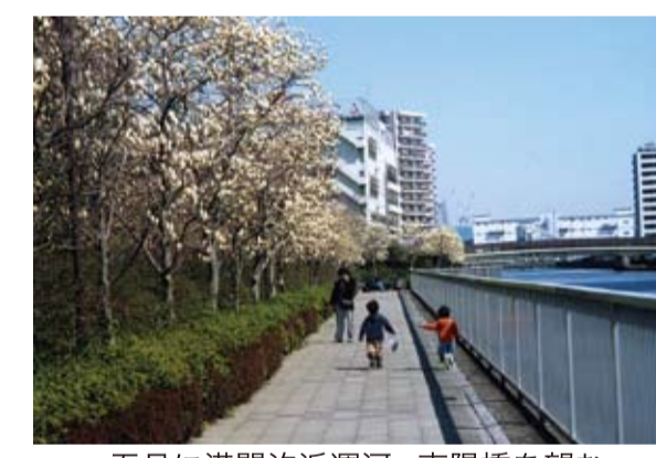
五月に満開汐浜運河・東陽橋を望む