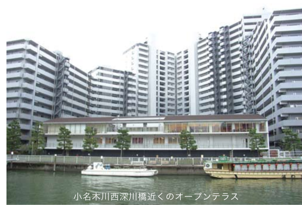
小名木川西深川橋近くのオープンテラス