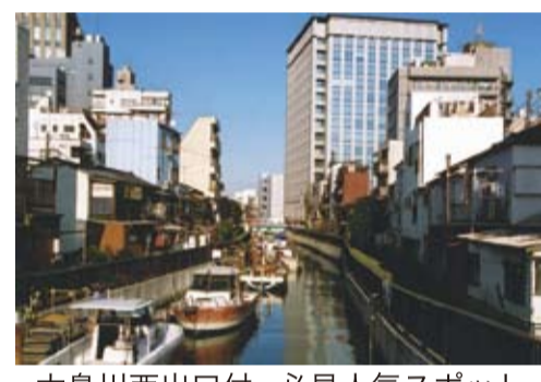
大島川西出口付・必見人気スポット