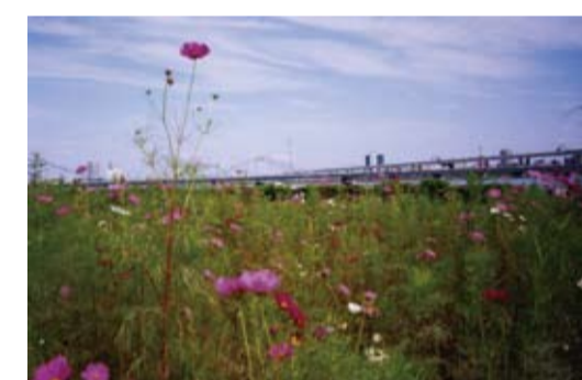
荒川砂町水辺公園よりコスモス越に葛西橋を望む