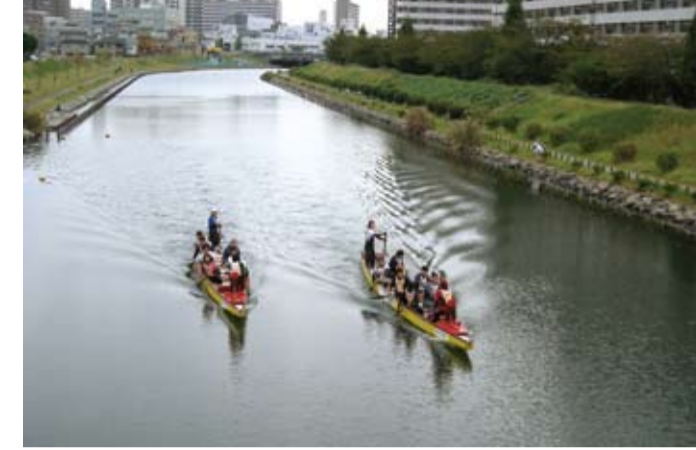
旧中川 (区立亀戸九丁目緑道公園付近)