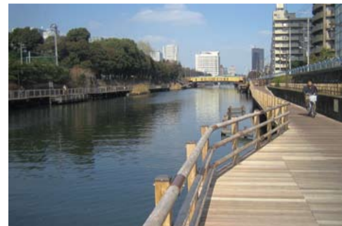
横十間川の木製遊歩道