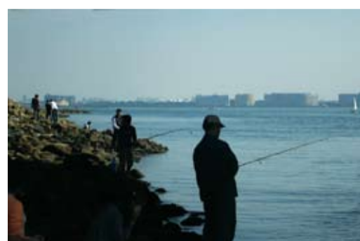
若洲橋付近でスキ釣りをする人