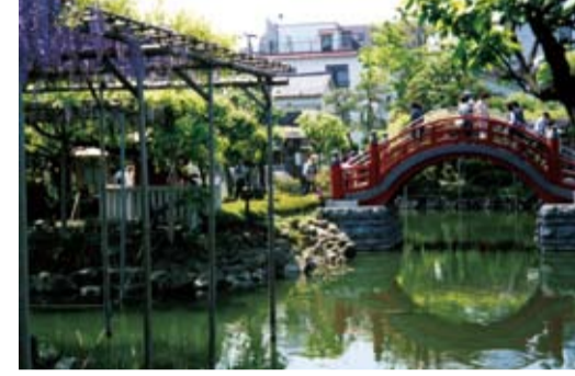
亀戸天神の藤と赤い太鼓橋