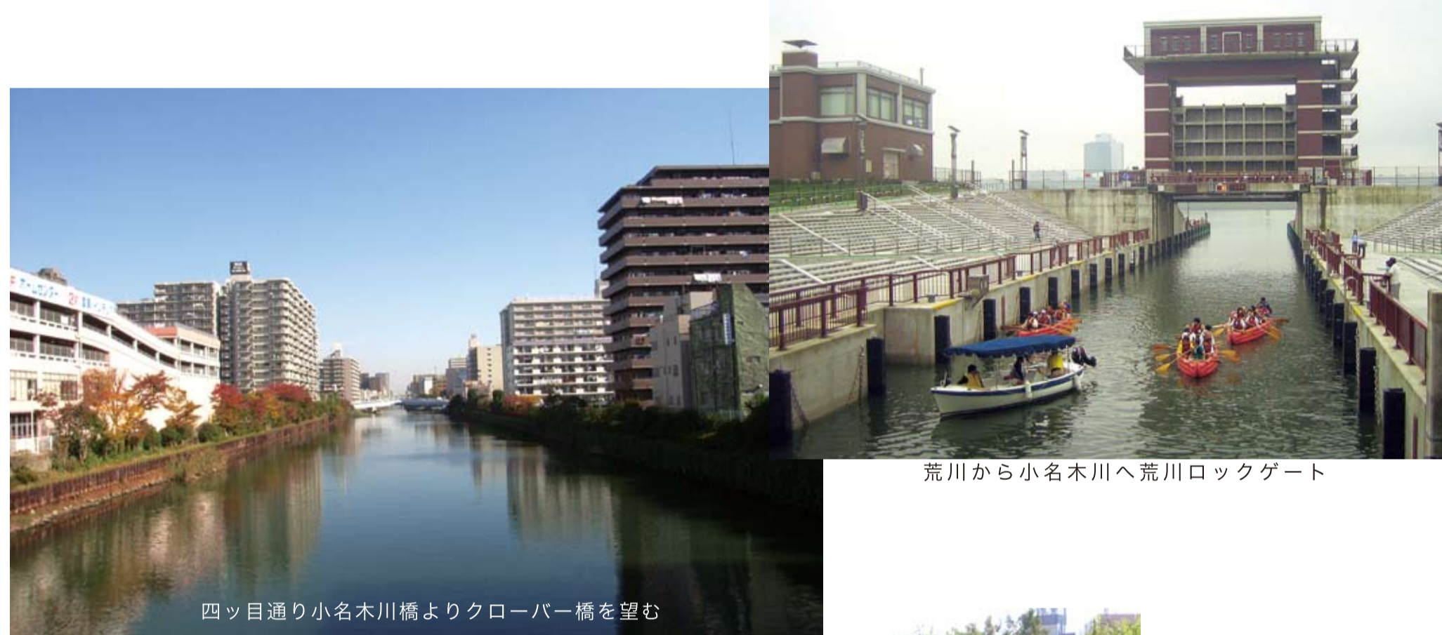
荒川から小名木川へ荒川ロックゲート