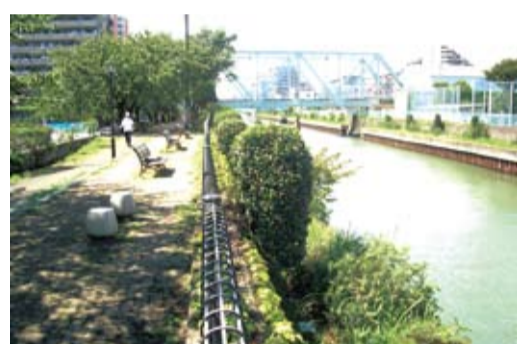
小名木川・進間橋近くから貨物専用線を望む