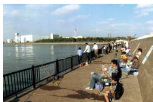
家族も集う若洲海浜公園海釣り施設