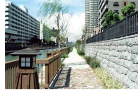
小名木川塩の道・番所橋付近