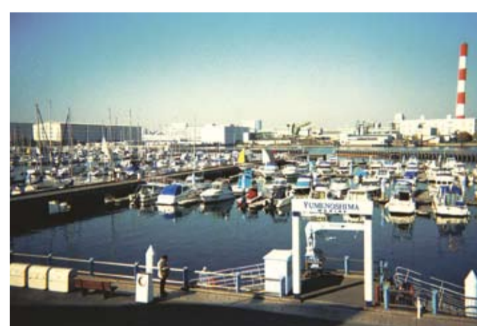
都内最大級のヨットハーバー・夢の島マリーナ