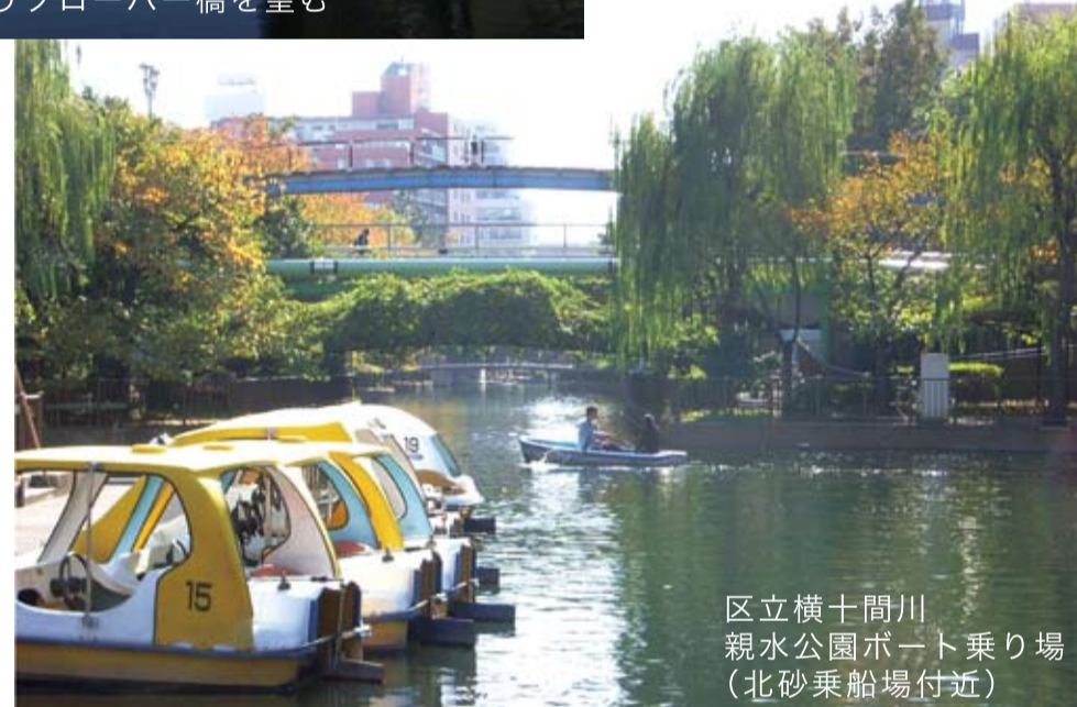
区立横十間川親水公園ボート乗り場 (北砂乗船場付近)