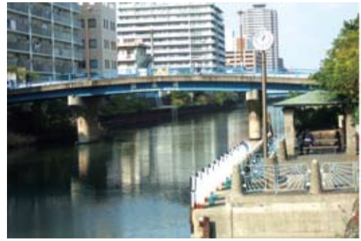
横十間川・錦糸橋近くの旧江東区観光船着場