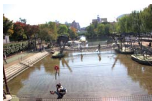
横十間川親水公園・水上アスレチック子供の天国