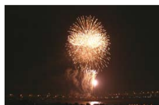
荒川砂町水辺公園から見える江東区花火大会