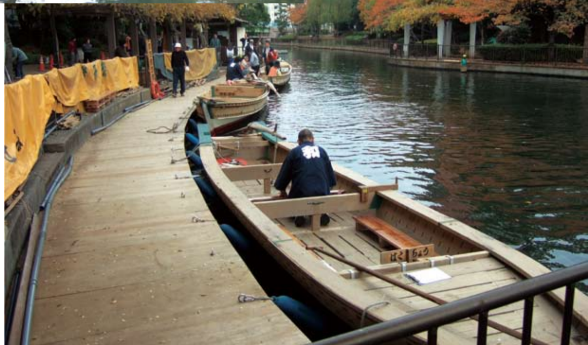
横十間川親水公園・櫓漕ぎの和船