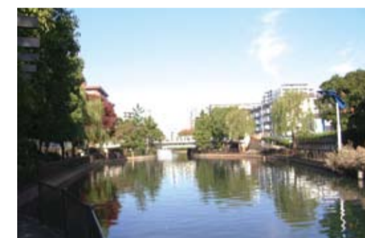
横十間親水公園・千砂橋を望む