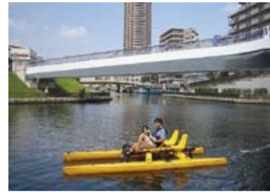
小名木川で楽しむ親子