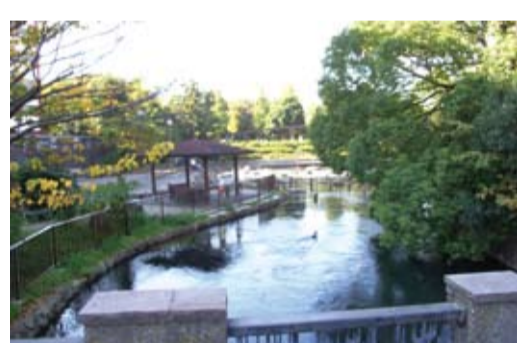
仙台堀川公園のはなみずき