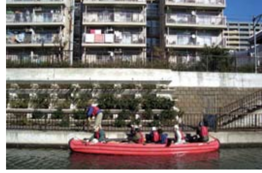
水辺の調査・北十間川親水公園で一休み