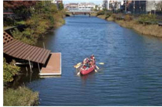
横十間川をボートで探索・亀戸3丁目龍眼寺付近