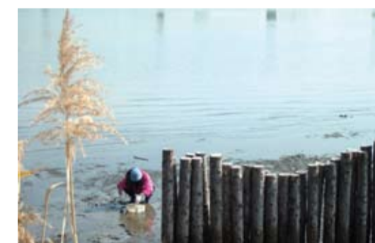
荒川河口干潟でじみ取りをする人