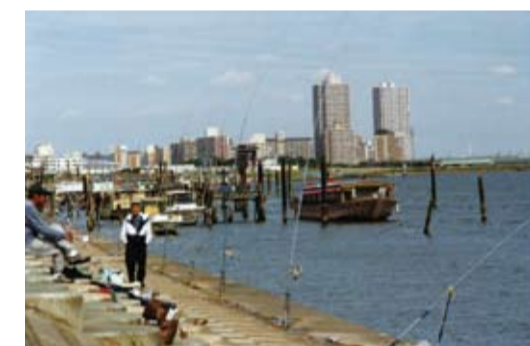
荒川河口で釣りを楽しむ・旧葛西橋付近