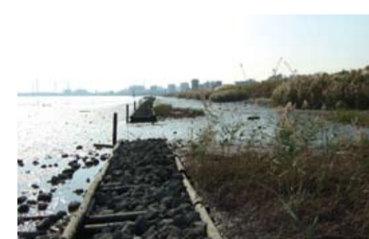
荒川河口干潟・エコロジーの心を育てる