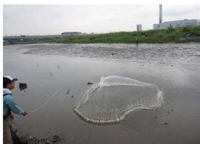
投網による魚類調査