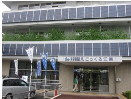
えこっくる江東のみどりのカーテン