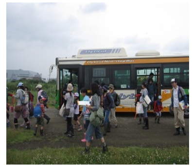
都バスで新砂干潟へ