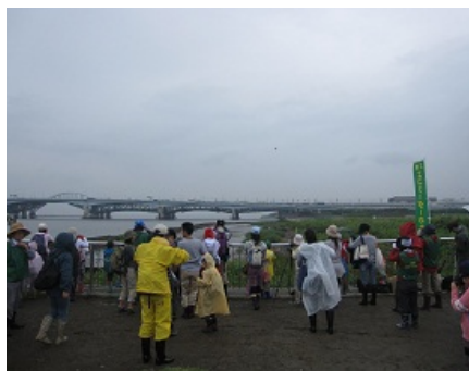
先ずは野鳥の観察から