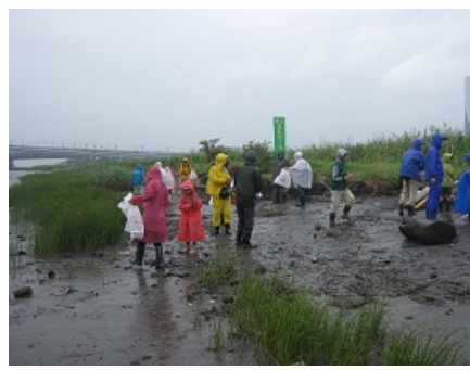
干潟クリーン作戦