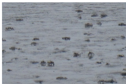
干潟のカニの体操