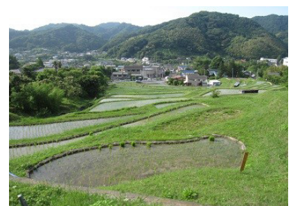
美しい上山口の棚田