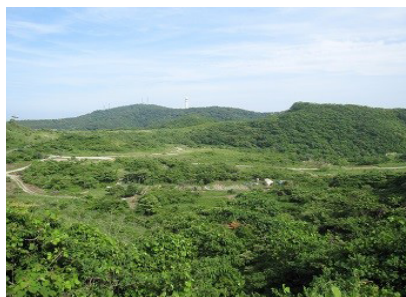
湘南国際村めぐりの森