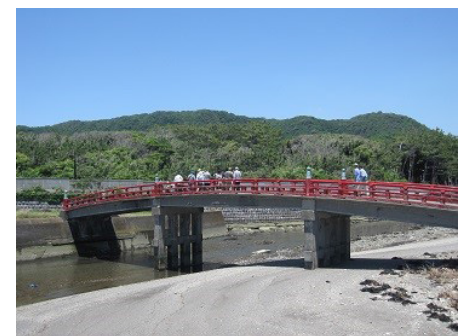
御用邸の横を流れる下山川