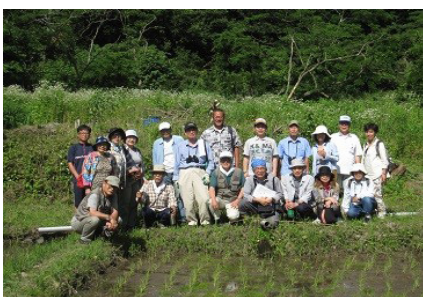
二子山山系の棚田で