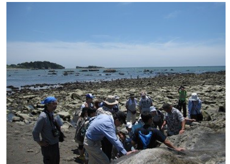
磯場の生き物解説