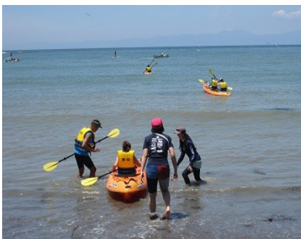
大浜海岸 浜辺の舟遊び