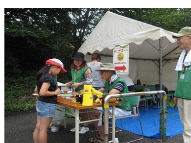
下船： あー楽しかった！