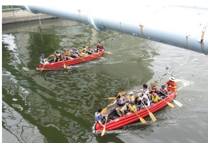
おーい負けないぞ！