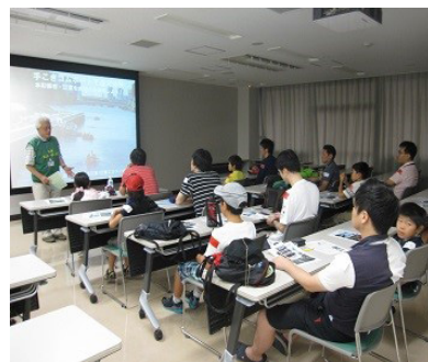
室内で川や海のお話