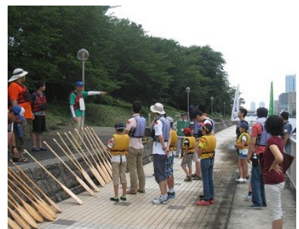
安全教育「安全第一」