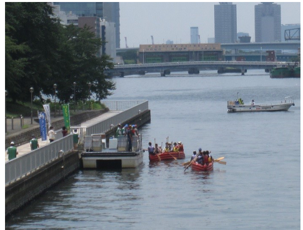
潮見運河 E ボート体験

えこっくる江東で、江東区の川や運河の話を聞き江東区の水運の歴史を知ることができました。その後、潮見運動公園のテントに移動し、最初に安全教育の話を聞き、その後ボートの漕ぎ方訓練を受けました。そして、ボートに乗り込み、皆で漕ぎ始め、歓声をあげてこぎ続けました！！