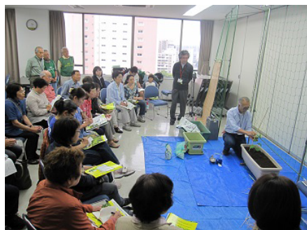
植え方のワークショップ