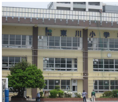
東川小学校でのみどりのカーテンネット張り