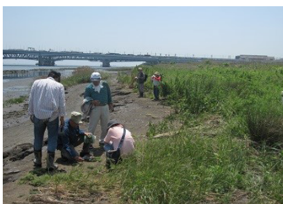
海浜部の植物調査