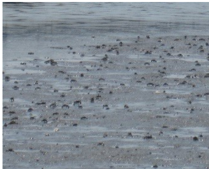
干潟はカニがいっぱい