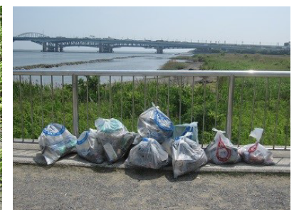
ゴミ袋にいっぱいのゴミ