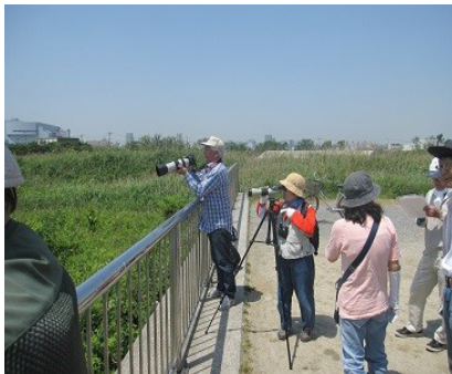
先ずは野鳥の観察から