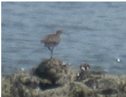
チュウシャクシギ