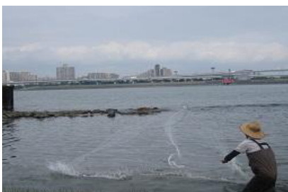
投網による魚調査