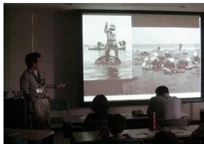
干潟の生物のお話