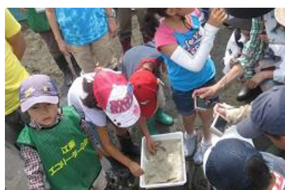
採集された魚観察