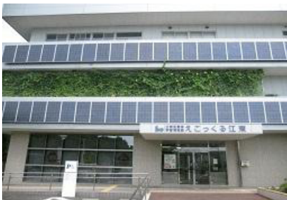
えこっくる江東の緑のカーテン