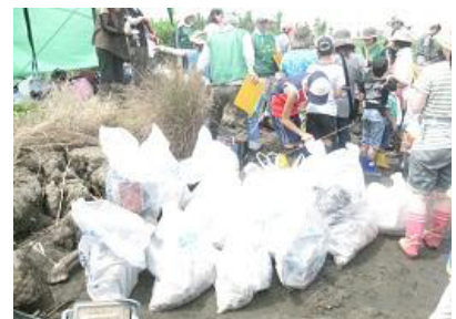
ゴミがたくさん収集されました