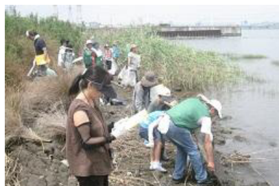
干潟クリーン作戦