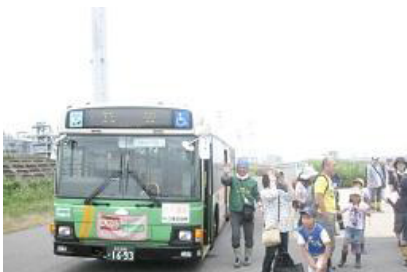
都バスに乗って新砂干潟へ