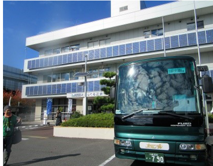
バスで干潟に向かう