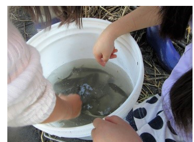
捕れた魚 ボラに感動!