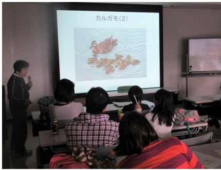
えこっくる江東で野鳥の話