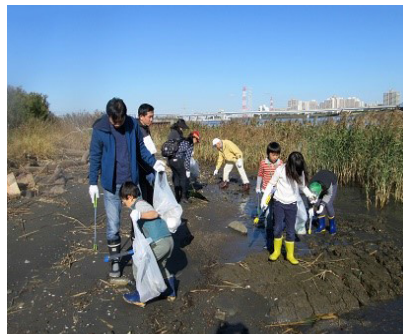
干潟のクリーン作戦