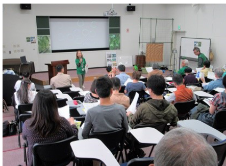
植え方のワークショップ