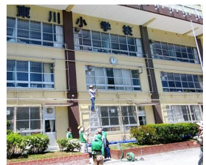
東川小学校のカーテンづくり