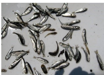
捕れた魚 ボラとハゼ