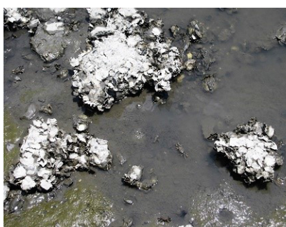
干潟のカキ礁とカニ