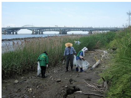
干潟のクリーン作戦