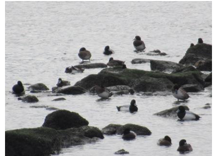
岩にはいろいろな鳥が