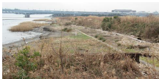
昨年の台風後遺症、まだ流木などが山積