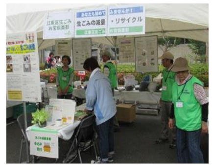
江東区生ゴミお宝倶楽部