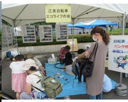
江東自転車エコライフの会