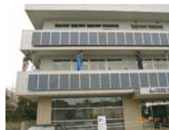
3月1日(日) フレーム設置