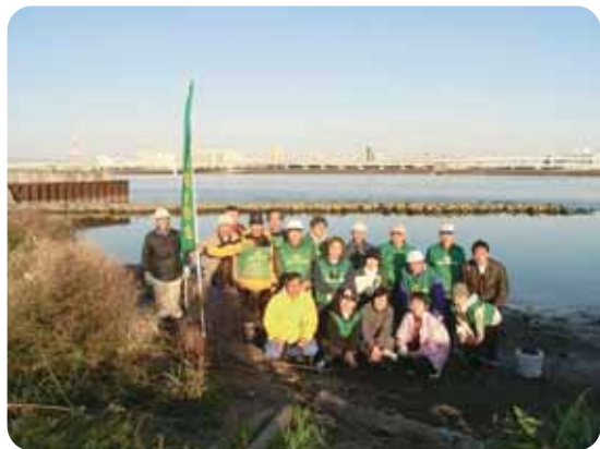
清掃作業及び講義終了後の 記念撮影

今回は一般の方の参加の募集はなく、まずは会員等の関係者だけで試験的に 行ないました。この体験を通して下記のように江東エコリーダーの会は活動 したいと思います。