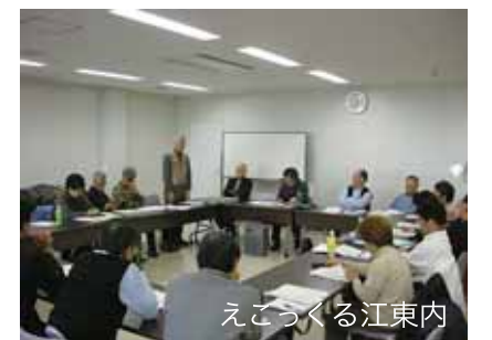
えこっくる江東内