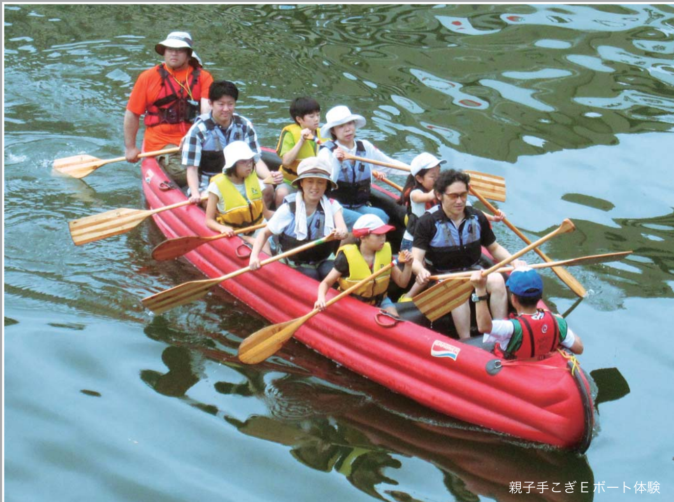
親子手こぎEボート体験