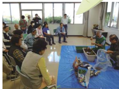
土づくりの実習及び、来春ゴーヤの苗を植えるまでの期間に、冬野菜を栽培する方法をお教えしました。