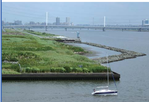
荒川湾岸橋より新砂干潟を望む