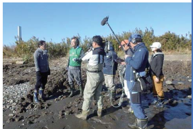
NHK 放送番組グッチ裕三さんによる新砂干潟取材