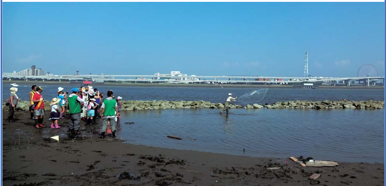
上記の写真は 2015年8月1日 親子で新砂干潟観察会